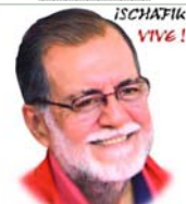
Homenaje a Schafik Mandat